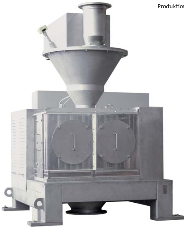
RC 500 Produktionsmaschine