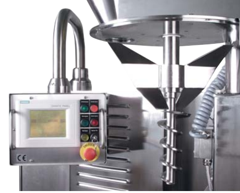
→ Touch-Panel und Dosierschnecke

Das Walzwerk mit horizontaler Walzenanordnung verdichtet das Material zu Schülpen. Die Formgebung der Walzenoberfläche bestimmt das Einzugsverhalten des Produktes. Die einstellbare Drehzahl der Walzen legt die Verweildauer des Materials im Kompaktierraum fest. Ein stufenlos einstellbares Hydraulikaggregat erzeugt den nötigen Pressdruck und überträgt ihn auf die Walzen. Die Hydraulik hält den eingestellten Walzendruck konstant und garantiert so eine homogene Schülpe. Abstreifer halten die Walzen sauber.