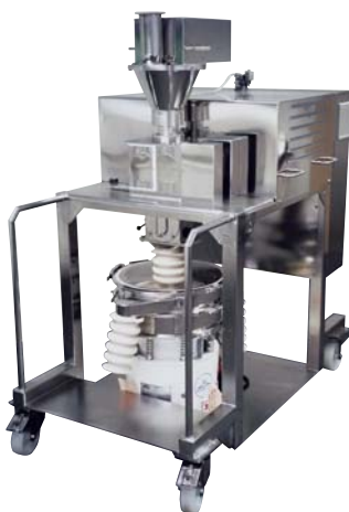
RC 100 Pharma mit integrierter Siebmaschine