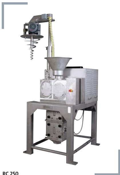
RC 250 mit pneumatischer Hubsäule und zwei Rotorsiebmaschinen

Ihr Pulver lässt sich nicht dosieren, die Staubbelastung ist zu hoch, das Löseverhalten nicht ausreichend, Sie haben Entmischungen oder das Schüttgewicht ist zu gering? Wie lösen sich Ihre Probleme mit Pulver und Staub in Luft auf? Ganz einfach: Mit Granulat aus Hochleistungskompaktiermaschinen von Powtec. Wir bieten Ihnen eine breite Palette unterschiedlicher Kompaktiermaschinen zur Pressagglomeration von Pulver und Staub, so individuell wie Ihre Anforderungen: Von der Labormaschine zur Verarbeitung weniger hundert Gramm bis hin zur Produktionsmaschine mit einer Leistung von über 4.000 Kilogramm pro Stunde. Der Anwendungsbereich dieser Technik ist sehr vielfältig, er reicht von A wie Arzneimittelproduktion über Chemiegundstoffe und Metallpulver bis hin zu Z wie Zitrusaromen für die Lebensmittelherstellung.